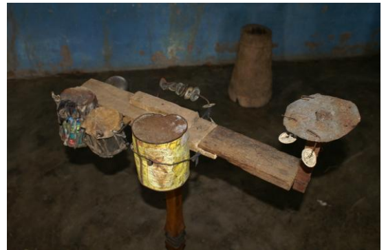
2007 St.Monica in Chikande Muziekinstrumenten tijdens de H.Mis