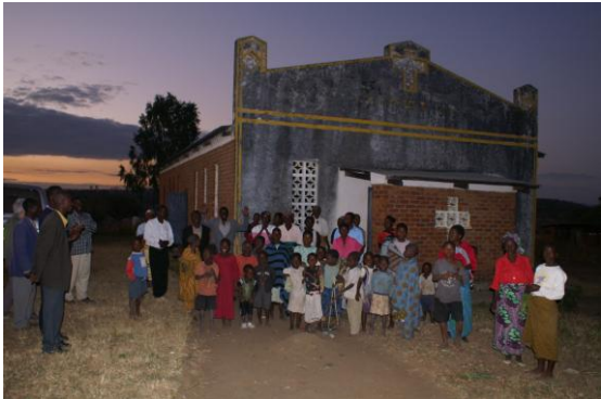
Het vijfde kerkje was St. Michael in Odala , kerkje gebouwd ca. 1987.

Tussen het golfplaten dak en de beschildering zijn de open gaten met cement dichtgesmeerd ter behoudt van het schilderij. In de kerk zijn bijna geen bankjes aanwezig.